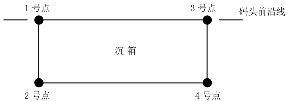
图 1 沉降观测点布置示意图