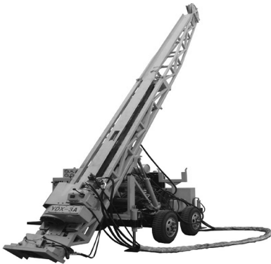
图 2 YDX-3 型动力头钻机