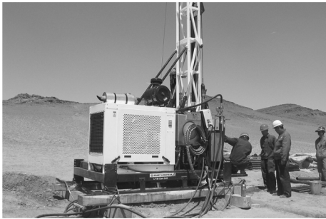
图 1 LF-90 型动力头钻机