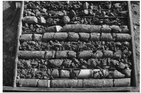
图 3 ZK1031 孔 177.55 ~ 185.78 m 孔段岩心