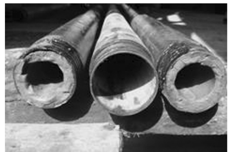
图 5 \phi 71 mm 钻杆内壁结垢情况

由于选用高固相泥浆(配方 9),容易导致钻杆内壁结垢(见图 5),影响绳索打捞取心,孔深 185.78 m 改用低固相泥浆(配方 7)后,既恢复了正常打捞取心,又提高了钻速,而且在泥浆中掺入锯末,还取得了明显的堵漏效果。