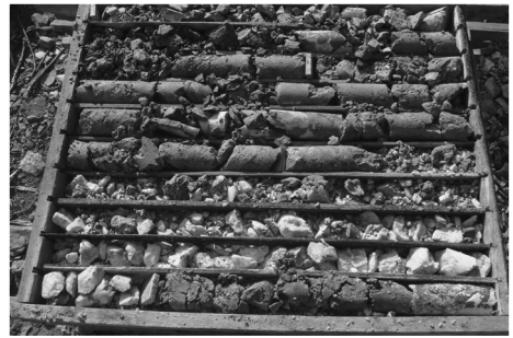
图 4 ZK1031 孔 294.78 ~ 302.95 m 孔段岩心

YS75 绳索取心钻进至 169.89 m 时遇断层破碎带,突然间钻进速度加快,返水量小,进尺 1 m 后堵水,打捞无岩心。停钻 1 天后,孔内坍塌物 0.8 m 厚,改用溶解浓度 1% 的 PAA 无固相冲洗液冲孔。当钻头扫触钻渣面时就开始堵水。在孔内水流不畅的情况下,采取反复清扫、捞渣、强行钻进、小径透( \phi 60 mm 口径)、大径扩( \phi 75 mm 口径)等措施,耗用 84 h 才使钻孔勉强延深了 7.66 m,岩心采取率不足 35%,而且还未穿过该层。