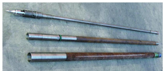
图 3 液压剪切式取样钻具实物

Ø75 mm 规格液压剪切式取样钻具参数为:钻具长度 3 m,钻具外径 73 mm,取心直径 43 mm,取心长度 1.5 ~ 2 m,钻孔直径 75 mm,配套内平绳索取心钻杆,其实物如图 3 所示。