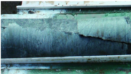
图 1 裂隙发育地层取出的岩心

地层本身节理发育、倾角大,有小断层。WFSD-2 孔施工中,47.8~311.39 m 孔段采用 \varnothing 245 mm 牙轮全面钻进,地层为花岗岩,通过取心发现,岩心破碎,岩心中存在较多倾角较陡的节理面(参见图 1)。另外,该孔段还存在倾角较陡( 70^\circ 左右)的小断层,钻遇倾角比较陡的节理时,地层的不均匀性和环壁间隙增大,容易导致钻头顺节理面和小断层面滑动,形成“顺层溜”。