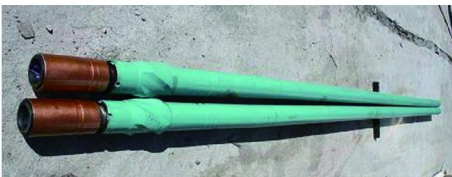
图3 5LZ120×7.0L-5( 0.5^\circ 、 0.75^\circ 弯外管)螺杆马达