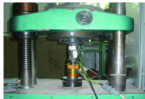
图1 单轴抗压强度及变形实验