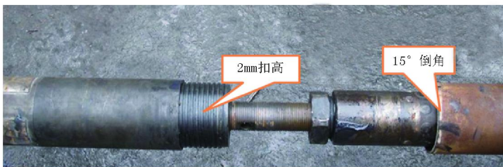
图 1 钻具改进对比图

钻进膨胀缩径地层时,如 WFSD-2 孔在 1680 ~ 1710 m 时,缩短回次进尺,若遇异常,立即提钻检查;下钻时,提前逐单根划眼,直到孔内顺畅后才开始钻