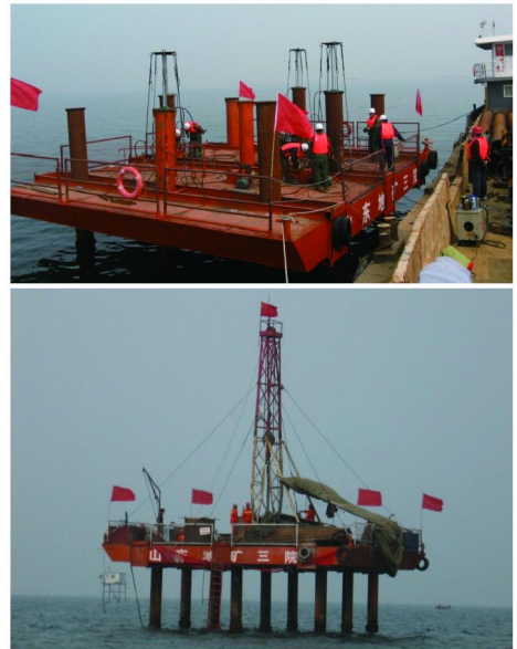
图7 平台安装及应用实际效果图

海上施工所用的平台类型很多,不同的平台有不同的特点,在确保安全的前提下,力求经济适用是选择施工平台最基本的要求。我院为了海上项目如桩基施工、地质勘探、工程地质勘察等工程的需要,设计了一套简易海上钻探平台,并申请了国家专利,成功进行了多个工程项目的施工,收到了很好的效果(见图7、图8)。