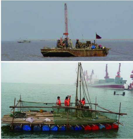
图6 用于工程地质勘察的浮式平台

平台类型和结构。这主要与工程施工需要的设备、工艺、施工周期、定位要求和方式等有关,特别是工程需要的平台承载力、面积、结构形式等。如钻孔桩工程由于其设备较大、工艺繁杂、作业面积较大、施工周期长等特点,通常采用桩式、重力式等稳定性好、平台面积较宽阔的平台。而工程地质勘察通常采用浮式平台,为了使钻机平衡,采用2船(泊)平行拼装,中间留有钻孔位置。工程勘察专用平台会在设计时将钻孔位置直接预留在平台上,对于测定地层参数较多、钻孔较深的,也可以采用桩式平台。物探工程要采用震动不能对物探仪器形成干扰的专用浮式平台。