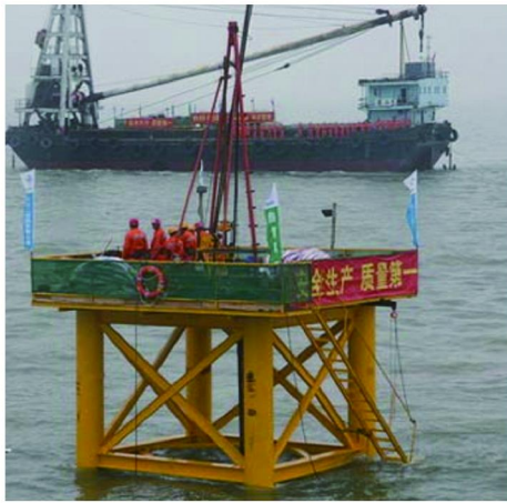
图4 桁架式重力平台