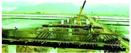
图5 盐州跨海大桥筑岛施工现场