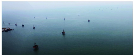
图8 莱州湾海上勘查施工项目全景

施工平台主要由钢管桩、甲板组成。平台甲板是由槽钢和工字钢焊接而成的桁架结构,为方便运输,平台甲板做成3 m×12 m,运抵码头后3个甲板拼装在一起成为一个9 m×12 m的大甲板,再整体吊运。甲板上分布9个Ø600 mm桩通孔,上面再铺设并焊接防滑钢板。平台甲板固定在9支桩上,平