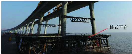
图3 杭州湾大桥施工使用的桩式平台