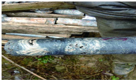
图2 岩心上的溶蚀通道

归结2钻孔漏失特点,均为岩溶裂隙水受压后发生漏失,且漏失通道1~15 cm不等,常规堵漏效果不明显。钻孔24 h安定水位均高于漏失层位,且不同的漏失位置安定水位有一定的变化。