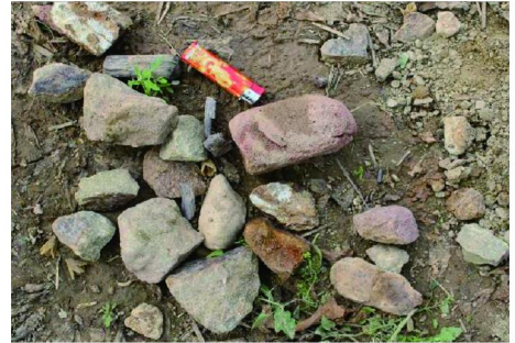
图 7 破碎地层返出的碎石