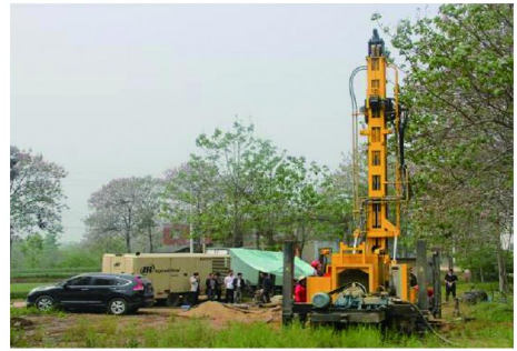
图 1 钻机和空压机试验现场

XD400B 型履带式多功能钻机,转速 60 ~ 120 r/min,适用于 500 m 以浅、口径 105 ~ 350 mm 的钻探;XHP1070 型空压机,额定压力 2.4 MPa、风量 30.3 m 3 /min;Ø102 mm 外平钻杆;Ø136 和 188 mm 冲击器;Ø155 和 205 mm 冲击钻头(球齿合金)(参见图 1、2)。