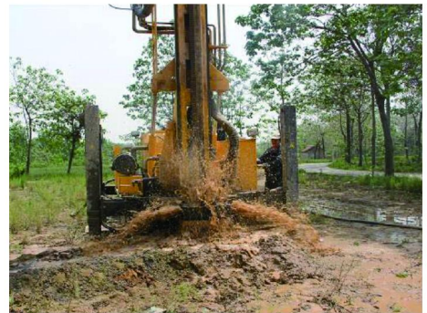
图 8 含水砂岩地层

回转钻进相比, 均能实现正常的快速钻进。表 3 是不同口径试验钻孔在不同地层中的机械钻速统计。