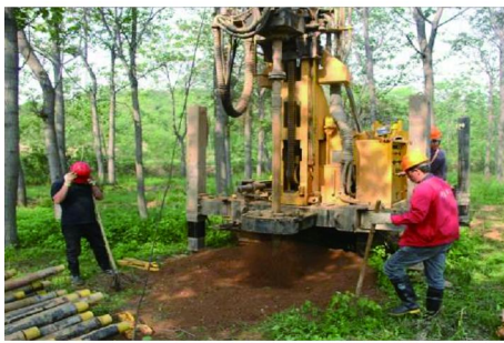
图 4 山前粘土地层