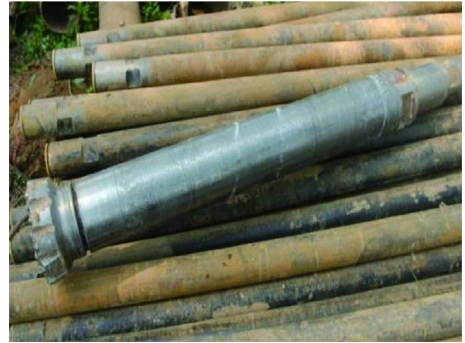
图 2 钻杆和潜孔锤