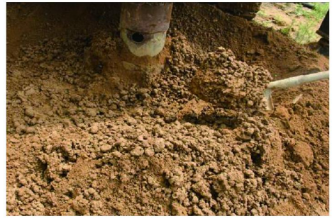
图 6 潮湿粘土地层

上述钻遇地层相对复杂并具有代表性。通过空气潜孔锤在这类松散地层中钻进试验, 与常规泥浆