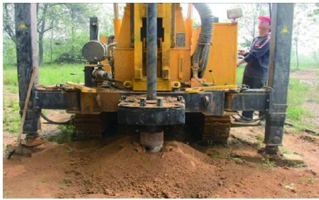
图 3 砂土和粘土互层

试验钻孔钻遇地层(自上而下): 干粘土、砂土、粘土、粘土夹砾石、潮湿粘土、破碎地层、泥岩、砂岩等。图 3 ~ 8 是钻遇不同地层的钻进和返出地面的岩渣的情况。