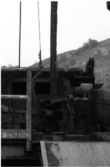
图5 盐重结晶的 Ø127mm 钻杆

更换盐水钻井液后,滤失量虽然很低(3~5 mL/30 min),但高矿化度条件下泥浆滤饼质量差,非常松散(测量完毕的滤纸一抖,泥皮就松散脱落);取心钻进施工裸眼井段较长,起下钻摩阻大。增添使用改性沥青粉(KAHM),一来改善泥饼质量,堵塞和覆盖泥页岩微裂缝,形成较坚韧的泥皮;二来,可起到润滑钻具降低摩阻的作用,尤其起下钻次数较多时,效果突出;三是,使用后完全不影响本井作为生产井的使用情况,盐岩使用水溶法开采,不会因为使用改性沥青粉覆盖产层而影响到后期的开采使用。