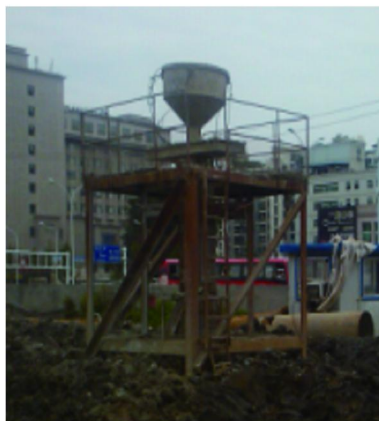
图6 刚浇筑完的立柱桩