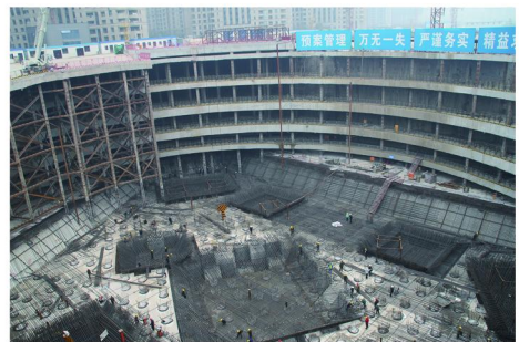
图7 绿地国际金融城超深基坑立柱桩

工法》(HBGF 145—2012)在武汉市汉口火车站旁天丰实业综合楼钢格构柱上的应用,各项技术指标达到了设计要求,同时施工的华中第一高楼绿地国际金融城(606大厦)超深基坑立柱桩也取得了良好的施工效果(见图7),为我在钢格构柱桩甚至是逆作法领域中夯实了坚实的基础。