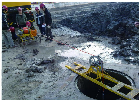
图2 检测设备对已成孔进行复测

8 \text{ m}^3/\text{h} ,风压为0.4~0.7 MPa,测量孔内沉渣厚度和泥浆密度,确认达到质量标准后,先关空压机,卸下导管帽,拔出风压管,进行正常灌注。