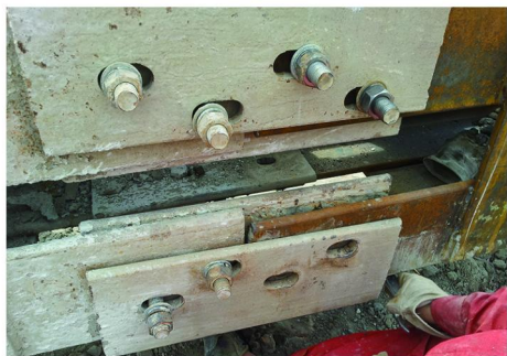
图4 高强螺栓连接辅助格构与立柱

(2)为保证钢格构柱能得到有效的调整,在钢格构柱上端接长3 m左右的辅助调垂格构(图4)。