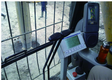
图1 旋挖钻机成孔监测

在钢筋笼和钢格构柱下放后,混凝土浇筑前,开动空压机清孔,风量、风压由小到大,正常风量为