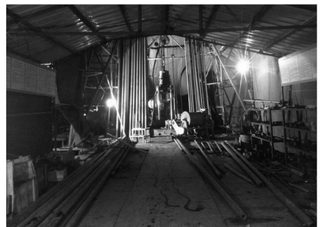
图 1 TLSJD-1 孔现场

钻机承重区、钻塔四角、钻机靠近孔口端和摆放钻杆处用挖掘机挖土深 1.5 m, 做 C30 混凝土基础, 施工区域全部采用混凝土硬化。施工区域旁挖 10 \text{ m} \times 5 \text{ m} \times 2 \text{ m} 废浆处理池。建泥浆池 3 个, 分别为 10 、 5 、 5 \text{ m}^3 ; 建沉淀池 2 个分别为 2 、 1 \text{ m}^3 ; 系统设置泥浆循环系统。