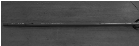
图 2 YL - 65 螺杆马达

在钻进过程中,500 m 以浅的孔段造斜比较容易,主要使用 YL - 65 型螺杆钻具(见图 2)。TLSJD - 1 造斜纠斜过程中使用的弯外管有 4 种:0.5°、0.75°、1.0°、1.25°,依据钻孔弯曲度选择不同度数的弯外管。