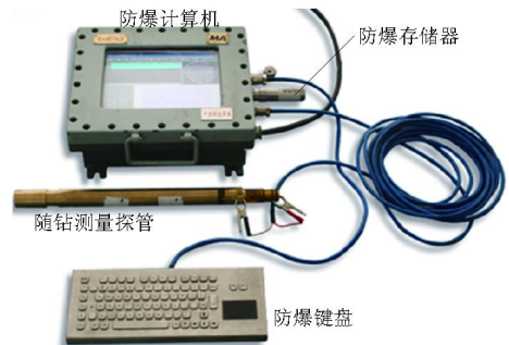
图1 YHD2-1000(A)型随钻测量系统

多年研究,成功研制出了4个系列型号的井下定向钻进用随钻测量仪器系统,其中,YHD2-1000(A)型随钻测量仪器系统是最新产品,由矿用防爆兼本安型计算机、本安型键盘、存储器和随钻测量探管组成,如图1所示,主要测量参数及精度见表1。