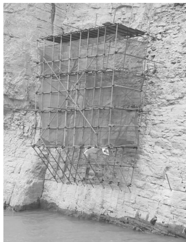
图2 脚手架钢管悬挑钻探平台

(3)锚固钻孔直径小,可用电钻或风钻成孔,设备轻便,搭设时的安全保障性高,平台结构见图2。