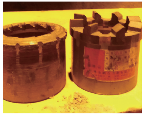
图 4 所用钻头及其非正常研磨情况

(2)施工队倾倒的喷浆料没有调查清楚,对其危害认识模糊;喷浆剩料与渣石形成的固结物增大了爆破清除的难度,费时较多,耽误了进度。