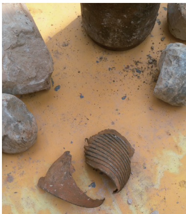
图 3 钻遇的岩心管及孔偏后取出的岩心

(1)施工中遭遇了之前钻机遗弃的套管、钻头以及爆破作业废弃的钎杆、铁板等,这些器物对施工极为不利,钻孔曾因此偏出溜渣井;用大一级的钻具进行扩孔校正钻孔才重回了溜渣井内。如图 3、图 4 所示。