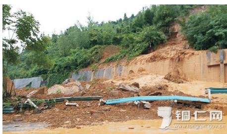
图 4 杭瑞高速公路 k1339+500 处山体滑坡(2016 年 7 月 4 日)

时准确地把握边坡的稳定性现状和发展趋势,必要时实施补强加固工程(包括锚索应力损失后的补偿张拉)或工程检测与监控量测,对高速公路的交通运营畅通和安全具有重要的指导意义和实用价值,也是管理风险向可控的技术风险转嫁的一个重要措施。