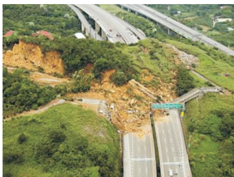
图 2 台湾基隆滑坡(2011 年 4 月 13 日)