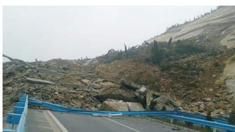
图 3 遵赤高速公路 391 km+800 处山体滑坡(2015 年 1 月 4 日)