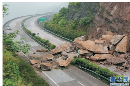
图 1 渝黔高速崩塌(2014 年 4 月 28 日)

评价和地质灾害危险性评估工作普遍性不够重视,而边坡突发性危害造成的损失往往巨大且不可逆转(参见图 1~图 4),除了一些不可抗力因素之外,管理层风险意识和责任意识未体现到实处也是一个重要原因。