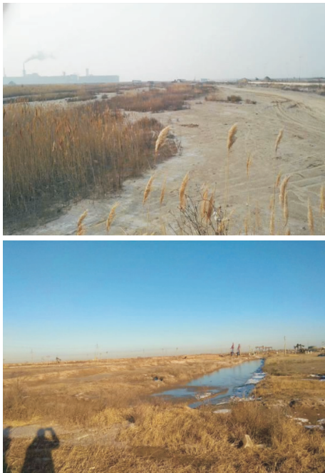
图 1 井场选址原始地貌

该地区属黄河三角洲冲积海积平原区沿海滩涂(见图 1),表层为第四系全新世松散沉积物,厚度 300~500 m,主要地层岩性为粘土、粉质粘土、粉土、粉细砂、中砂等。场地选址区域内 1 m 深度范围内的表层土体为粉砂质粘土,土体成分见表 1,基本性能参数见表 2。