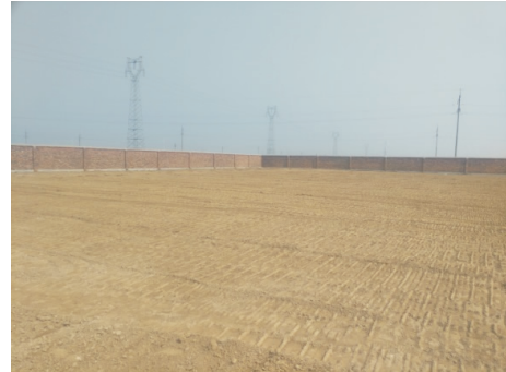
图4 铺垫完成的场地