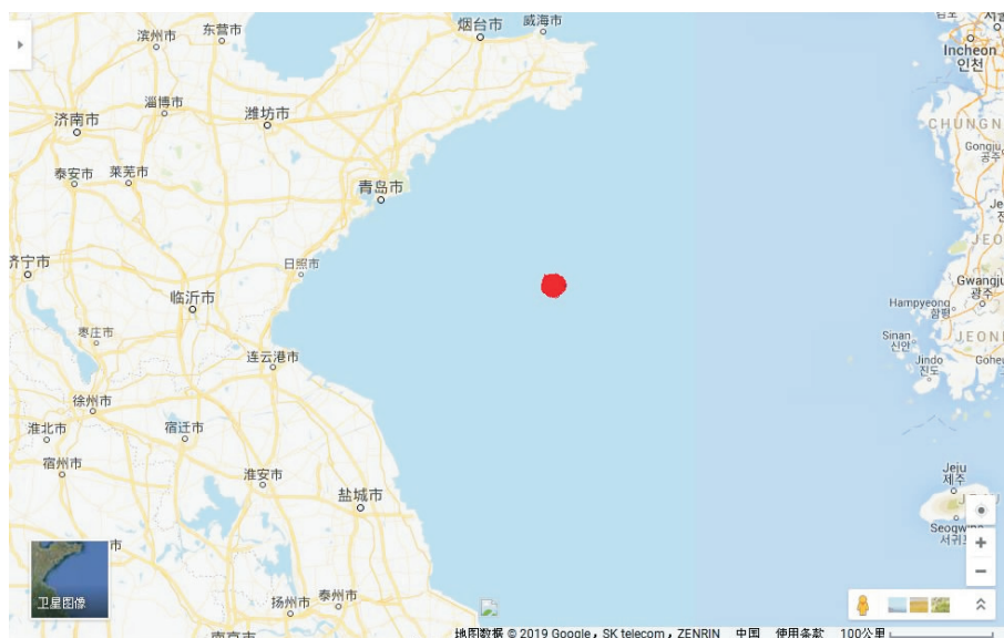
图 1 项目交通位置图