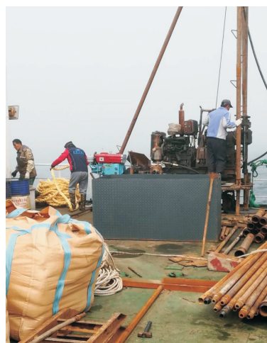
图 2 施工现场图