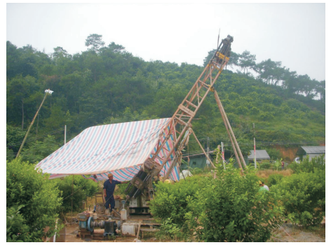
图 1 XY-42T 型钻机施工斜孔状态

为满足大角度斜孔施工要求,综合考虑地层情况、钻孔深度、拟采用钻进方法及工艺等,选用 XY-42T(图 1)、XY-44T 型塔机一体式钻机,采用柴油动力,配 BW-150 型泥浆泵。