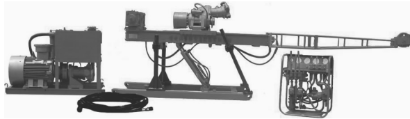
图 1 ZDY1000G 型全液压坑道钻机

选择 ZDY1000G 型全液动力头式坑道钻机(结构见图 1)。该钻机转速高,系煤矿和金属矿井钻探的多种用途的钻孔。既可满足地质勘探、瓦斯抽放、注水及其它硐内工程施工,也可用于地面勘探施工,适用于金刚石、硬质合金钻进和冲击回转钻进。