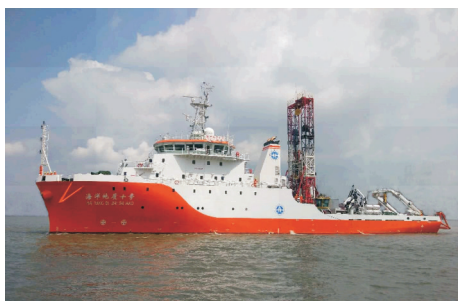
图 1 海洋地质十号船

海洋地质十号船是一艘以举升式岩心钻探为主、兼顾地球物理调查和海洋水文环境调查的综合调查船。它的投入使用将填补我局海洋地质调查钻探船的空白,提升我国中深水的资源调查和海岸带综合地质调查能力。海洋地质十号船采用全电力推进系统,选用 2 套全回转舵桨和 2 套槽道式艏侧推,具有良好的航向稳定性和灵活的操作性能,在直航时具有良好的航向稳定性。配备 DP-2 动力定位系统和锚泊定位系统。为多种调查作业方式提供可靠的定位方式。海洋地质十号船采用模块化设计,固定装船设备有地质钻探系统、万米单波束测深仪、中深水多波束测深系统、中深水浅地层剖面仪、海洋重力测量系统、声学多普勒流速剖面仪(ADCP)、超短基线水下定位系统、万米绞车及 A 型架系统、液压折臂吊。海洋地质十号船还可以进行海洋井下式原位静力触探(CPT)作业。图 1 为海洋地质十号船。