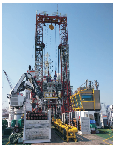
图 2 海洋地质十号船钻探系统