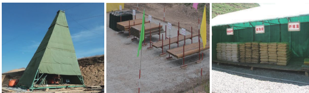
图4 机台现场外部设置