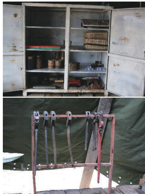
图2 机台内部材料箱、工具架设置

立轴式钻机场房内左侧应设置各类岗位职责牌、制度牌;全液压钻机场房内右侧设置岗位职责