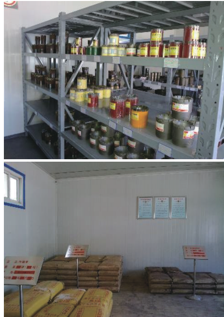
图5 库室标准化设置

(5)环境修复与治理。开孔前必须设置废浆池,底部铺设防渗、防污染塑料膜(布),防止废液外流,终孔后全部废液集中到废液池中,进行硬化无害处理并掩埋,及时回填泥浆池,防止伤害人畜。生活垃圾和废弃物必须统一进行处理。复垦复绿,清场完毕后,做好草(林)地复绿、耕地复耕工作应达到现场无污染破坏痕迹,生态恢复良好,环境协调。草种及林木品种应适应当地生长并于原草(林)地环境协调;耕地经深翻、松土及覆土后,应满足耕种