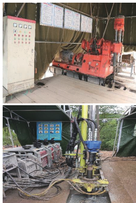
图3 标准化机台内各类职责牌、警示牌设置

牌、制度牌,包括《安全生产管理制度》、《机长岗位职责》、《班长岗位职责》、《泥浆岗位职责》、《记录岗位职责》;根据现场实际在场房醒目位置设置各类安全警示标识牌,提醒钻探人员规范操作,切实提高从业人员安全防范意识。图3为钻机厂房内各类职责牌、警示牌设置。