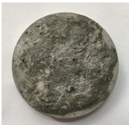
图3 3 mm 孔板的封堵效果