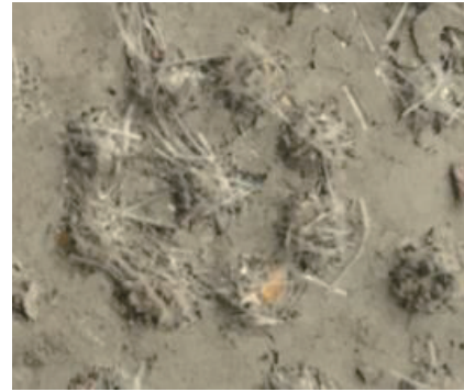
图4 干燥后的局部泥饼

对于1~2 mm 的孔板和缝板,当水泥和 Strata-vanguard 颗粒进入裂缝中时,在压力作用下迅速脱水而有效堆积堵塞裂缝;对于3 mm 的孔板和缝板,由于裂缝相对更大,颗粒不足以封堵裂缝,此时聚丙烯纤维在裂缝附近交织形成网状结构,将裂缝