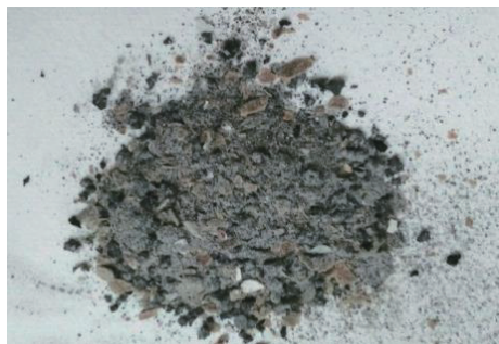
图1 高固相堵漏材料 Strata-vanguard

采用聚丙烯纤维(长度6~13 mm)作为主要的堵漏材料,纤维作为惰性材料,加量较少时基本不影响水泥浆的常规性能(如流动性),同时能够提升水泥的抗压、抗折强度,在地层裂缝处可以起到网格化和拉筋作用。同时,采用高固相堵漏材料Strata-vanguard作为桥塞封堵剂,其颗粒级配丰富(有片状,也有粗颗粒和细颗粒),适用于各种缝宽裂缝的封堵,其外观如图1所示。