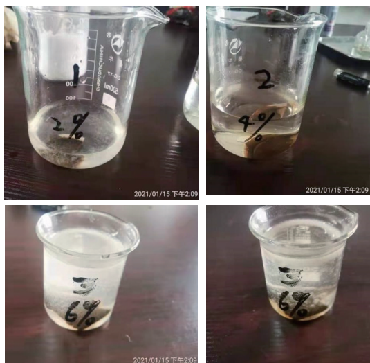
图2 加入不同浓度氢氧化钠溶液