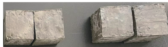
图3 固化后样品形态