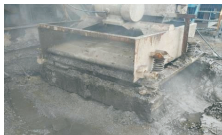
(b) 振动筛分离出的岩粉