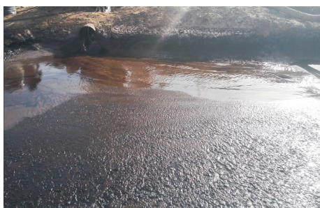
(a) 调整前钻井液流变性能(稠化严重)

(1)抗温能力强。原钻井液稠化严重,见图 1。调整后的耐高温钻井液未出现明显增稠(或胶凝)及减稠现象,最高使用温度 236 ℃。