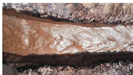
(a) 井口返出的钻井液状态

(3)流变性能好。具有良好的流变性能,泵压稳定,岩屑携带效果好,地表利用振动筛即可较好的清除钻井液中的岩粉,钻井液密度保持相对稳定,见图 3。