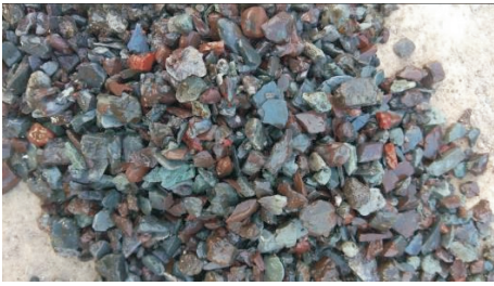
图 4 2800~3100 m 扫孔带出的掉块

(1)护壁效果好。该孔钻进至 2800~3100 m 时,坍塌掉块较严重(见图 4),在原钻井液基础上增加防塌剂和封堵剂,后续钻进过程中无坍塌、掉块现象。