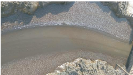
(a) 调整前钻井液流变性能

(2)流变性好。通过补充包被剂及高温增粘剂,调整后的钻井液具有良好的流变性能(见图 5),泵压稳定(8~10 MPa)。