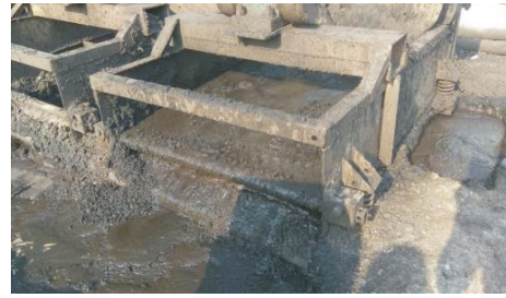
图 6 振动筛清除的岩粉