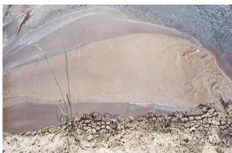
(b) 调整后钻井液流变性能