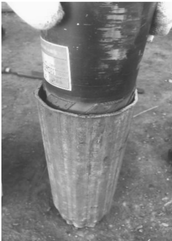
图2 膨胀波纹管场地实验情况

经过地面多次焊接及地面打压实验检测确认,打压压力保持22 MPa,波纹管基本撑开,最小内径达79 mm,可满足钻孔的后续施工要求(参见图2)。