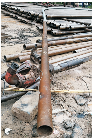
图 5 内管和配重连接

进行闭式循环,只取热不取水,是一种绿色的供暖换热方式。由于环保、清洁低碳、无污染等特点,将是北方地区清洁供暖的重要技术手段之一。