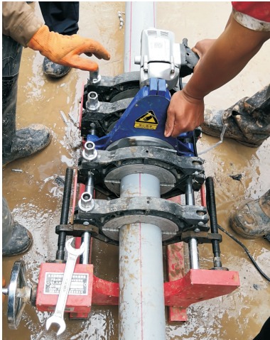
图 2 热熔连接内管

PE-RT II 型耐热聚乙烯热力管采用热熔连接方式(见图 2),施工方便。为了提高下井效率,下井前先将每三根(12 m×3 根,根据场地条件灵活掌握)进行预连接。根据厂家提供的焊接参数严格施工:管材焊接温度 240 °C ;吸热时间 123 s ;压力冷却时间 \geq 14 min。