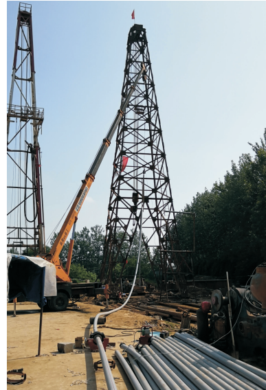
图 3 下内管

钢丝绳盘在卷扬机上,通过卷扬机刹把制动和配重的下坠力下管,吊车辅助将内管拖动向井口移动(见图 3)。