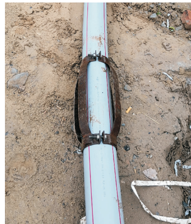
图 4 扶正器

配重的选择要考虑扶正器对井管的摩擦力。本井配重选用 \text{O}133 \text{ mm} \times 6 \text{ mm} 无缝钢管和圆钢组合使用。内管与配重的连接方式为:先将圆钢放置入钢管,再将内管插入钢管中重叠 10 m 打孔穿钢筋连接(见图 5)。