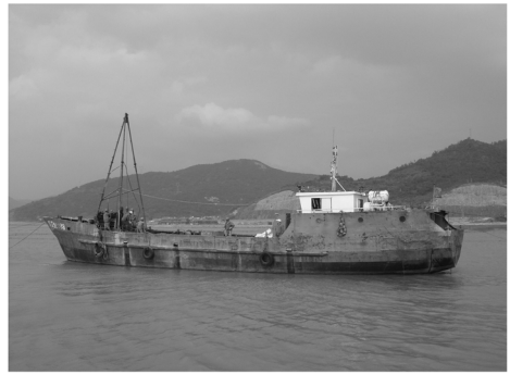
图2 自航式船体中心式单体钻探船

架空钻场满足承载钻探设备、人员及抗风浪的结构强度即可。我院主要是用脚手架搭建的钢管桁架式钻场(图5),现场拼装,平台面一般高出水面(高潮位)不低于1.5 m,载重安全系数(钻场额定荷载与设计钻探荷载之比)应大于3。