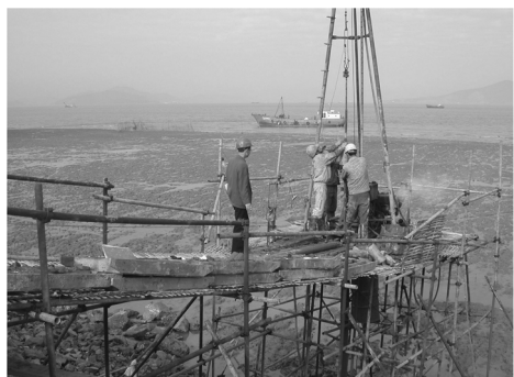
图5 钢管桁架式架空钻场