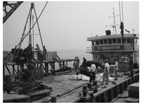
图3 自航式船侧伸出式单体钻探船