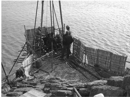
图6 西堠门大桥钻探钢管桁架式施工平台

架式架空钻场,租用建筑用脚手架,在低潮位时用风钻钻出桁架固定支点,现场安装固定,平台面高出高潮位不低于1.5 m,平台上铺设竹片,平台四周加高度不低于1.2 m护栏(图6),完成单孔孔深达60余米。