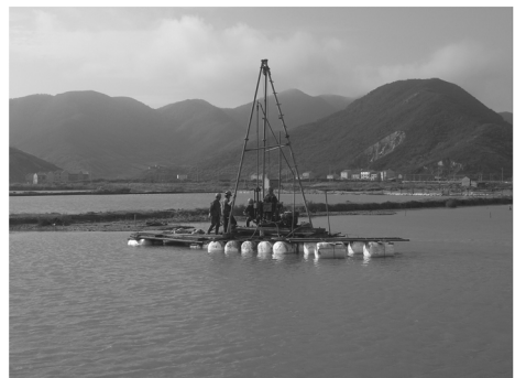
图4 拖航式泡沫钻场