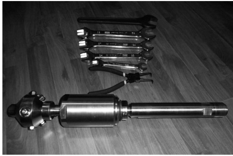
图 2 高压喷射装置及专用工具

由我单位研制的高压喷射装置,包括喷头、喷嘴、旋转体、连接杆、特制接头等。其材质为高强度不锈钢,强度高、耐磨、抗腐蚀;丝扣联接采用 3/4NPT 扣型,具有连接强度高,密封性好,安全可靠等特点。高压喷射装置及专用工具见图 2 所示。