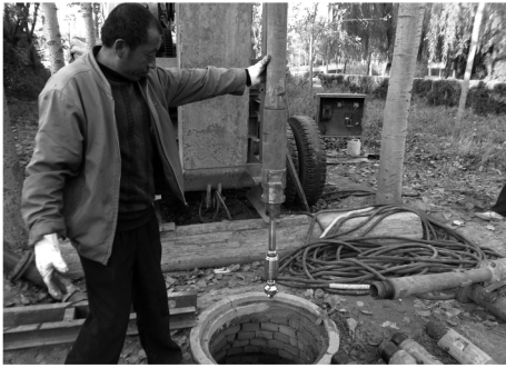
图3 高压旋喷洗井装备