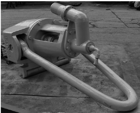
图2 150 t气水龙头

按钻孔直径600~1500 mm、钻孔深度1000 m,设计水龙头参数如下:最大承重150 t,进气口直径25.4 mm,排渣口直径130 mm、带5 in由任与排渣管连接,设风管悬挂机构,整套风管自此引出,如图2所示。