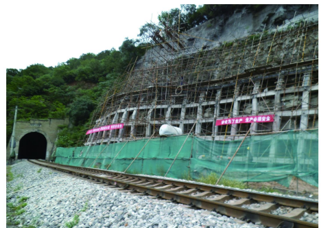
图 4 边坡加固结构施工现场照片

(2)正式施工前,先对坡面上的活动石块及强风化层进行人工清除,清除到中风化较稳定层位或弱风化稳定层位。清除作业完成后再人工搭设加固结构施工脚手架,满足加固结构施工要求。施工现场照片见图 4。