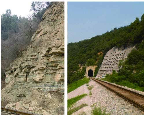
图 1 边坡灾害隐患情况及治理竣工照片

塌、落石灾害发育等特点, 提出了清理边坡岩体表面风化层和活动石块、采用喷射砼面层防止岩层表面进一步风化、在喷射砼层面上采用预应力锚索框架结构防止山体发生崩塌灾害的治理方案。2013 年 5~6 月对该边坡实施了工程治理施工, 2013 年 7 月陕西延安地区发生特大暴雨灾害, 该治理边坡在暴雨中没有再发生滑落、崩塌和落石等灾害现象, 初步说明治理方案设计合理, 施工效果良好。边坡治理竣工状况见图 1(右)。