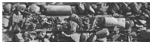
图 2 孔深 867~869 m 孔段破碎岩心图片