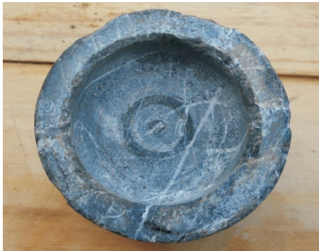
图 5 ZK7-11 钻孔 695.50 m 小径导向增压纠斜法岩心 Fig.5 Core obtained by small diameter pilot drilling and deviation correction by increase of WOB at 695.50 m of ZK7-11 Hole

设计范围内。而倾角则会出现“上漂”和“下倾”两种情况,钻进过程中将孔斜测量加密至 15.00~20.00 m,如钻孔倾角“上漂” [12] 则立即采用正常钻压的 1/3、转速控制在 300 r/min 参数“减速法”钻进,可逐渐纠回钻孔倾角到设计范围内;如钻孔倾角“下倾”则采用“小径导向增压纠斜法” [13-15] 可将钻孔倾角纠回至设计范围内(ZK7-11 钻孔 695.50 m 纠斜岩心见图 5)。