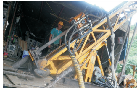
图2 XDJ-4型全液压岩心钻机

常规使用的全液压钻机不能拆卸、分解搬运,无法适应本矿区的钻孔之间人工搬运条件,经过组织技术人员到国内全液压钻机主要生产厂家多方考察,最终决定采用山东省地质探矿机械厂生产的XDJ-4型全液压岩心钻机(见图2)作为新型设备投入矿区施工。