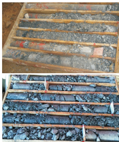
图 4 长安金矿区部分岩心

(3)下部地层为奥陶系向阳组二段( O_{1x^2} ),特点是坚硬、打滑;向阳组构造岩为泥砂质碎裂岩、角砾岩和糜棱岩、断层泥,特点为破碎、易垮塌、水敏缩径、漏失严重、护壁困难(参见图 4)。钻进方法采用 \phi 96/76 mm 两级绳索取心钻进取心,复杂及严重漏失孔段采用 \phi 110 mm 扩孔、下入 \phi 108 mm 套管护壁方法进行施工。孔深若到 500 m 深则换 76 mm 口径施工,如遇角砾岩和糜棱岩、断层泥严重影响,绳索取心钻进工艺无法顺利穿过时,则采用 96 mm 口径扩孔解困后使用 \phi 76 mm 绳索取心钻进施工直至终孔(见表 2)。