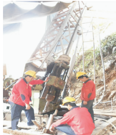
图1 XY-44T塔机一体型钻机

(2)新型设备:甲方要求须在原施工基础上采用20%的新设备、新工艺作为进一步合作的条件,由于