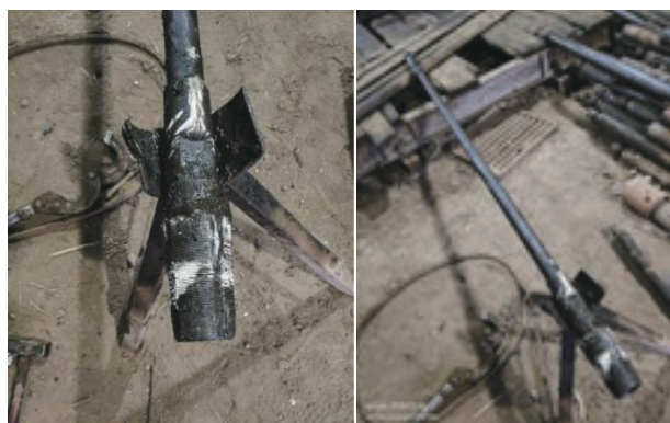
图3 钻具带有方解石印记