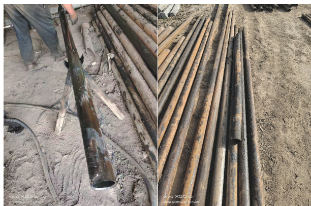
图2 被割断取出的套管