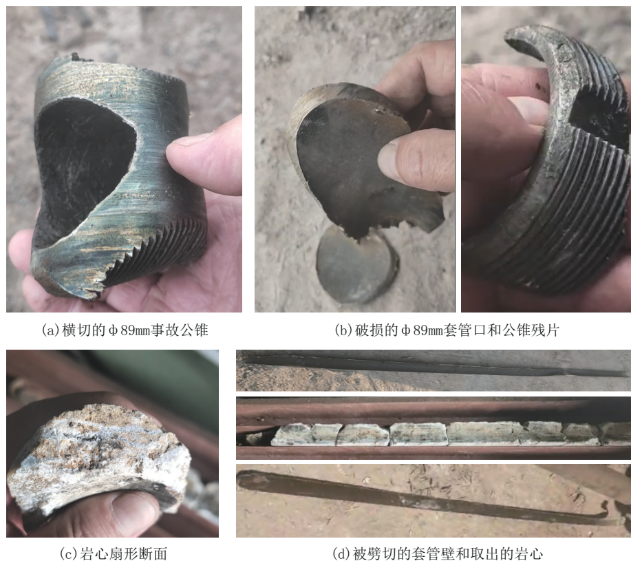
图6 混凝土浇筑绕障过程中取出的事故钻具及岩心图片