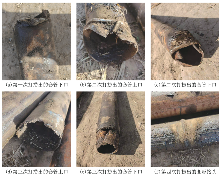
图1 打捞上来的事故套管接头受损图片