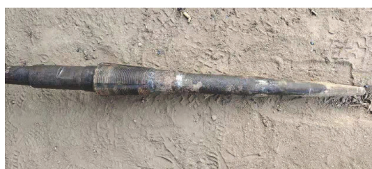
图4 带有导正头的 Ø89 mm 正丝公锥