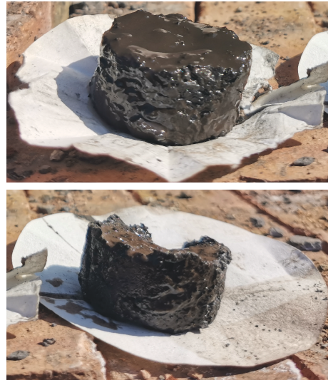
图7 成膜体系冲洗液浸泡的岩样

小口径钻探受钻孔环状间隙限制,许多大颗粒岩屑无法通过环状间隙返出,大量岩屑在孔底堆积,造成泵压升高、扭矩增大,更加严重的情况出现别车、憋泵,无法正常钻进。因此,在1944~1949 m、2201~2220 m等孔段多次采用取粉管、取粉钻具、干烧捞渣的方式清理孔底。