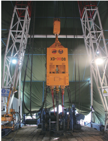
图1 XD-30DB型顶驱钻机 Fig.1 XD-30DB top-drive rig