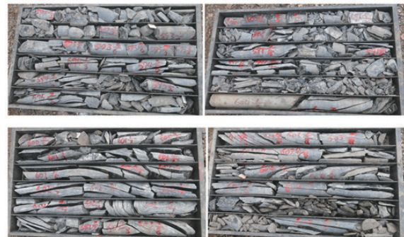
图3 孔深 1770~1820 m 垂直节理裂隙发育地层岩心 Fig.3 Cores from vertical joint and fracture developed formation at depth of 1770m to 1820m

(1)地层原因:从孔深 1720 m 开始,地层以灰岩、泥岩为主,垂直节理发育,孔壁岩石应力释放及受到孔内冲洗液的“激动”压力容易块状剥落,从 1812m 开始,每回次钻进需扫孔 4~5 m 才能到底,地层的不稳定是导致卡钻的主要原因。地层岩心见图 3。