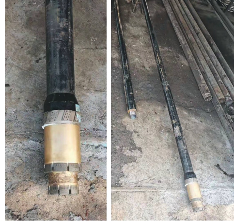
图 9 特制异径钻具及钻头