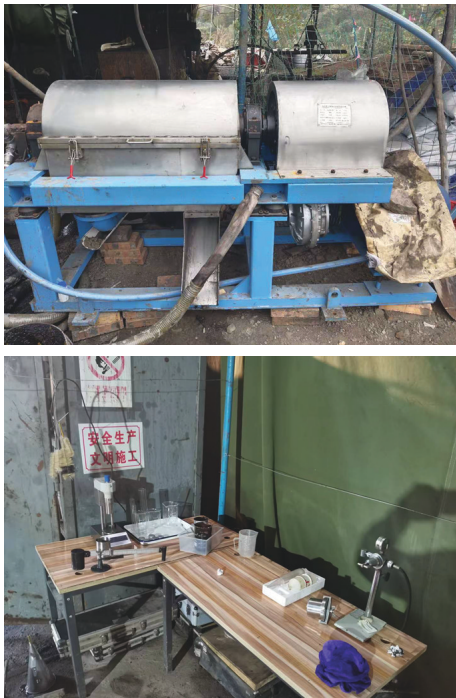
图 8 现场配备离心机及搭建的简易冲洗液测试台

针对 1720~1920 m 孔段出现的垂直节理裂隙地层,主要采用低固相聚合物冲洗液体系,针对 1947~1955 m 出现破碎严重的水敏性地层,主要采用成膜体系冲洗液,同时现场建立简易冲洗液测试台,及时测试冲洗液性能并进行调整,同时配备了离心机,做好冲洗液净化工作(见图 8)。