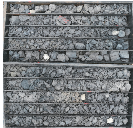
图6 孔深 1947~1955 m 岩心照片

\angle 1.16 来平衡地层压力;增加动切力来提高携粉能力;增加封堵材料,提高冲洗液的封堵性,稳定孔壁;适当控制漏斗粘度,稳定冲洗液循环泵压;降低失水量,防止水敏性地层坍塌。坚持钻进至 1962 m,再次发生坍塌、缩径卡钻事故。从孔深 1937 m 钻进到 1962 m,历时 5 个月,异常艰难。