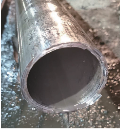
图4 水力割刀割断的事故钻杆