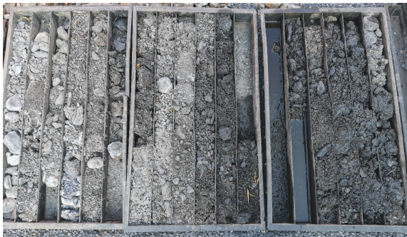
图5 捞取的孔底沉渣

钻探环状间隙小影响,大颗粒沉渣无法通过冲洗液携带出孔外,造成别车、憋泵严重,进尺困难,严重影响施工进度。