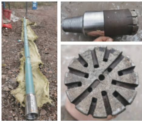
图10 侧钻采用的螺杆钻具及造斜钻头

杆。下钻至孔底0.5~1.0 m开泵冲孔,接触孔底前轻压慢放,在钻具接触孔底开始工作后固定机上钻杆不得回转。从孔深1850 m开始侧钻,泵量控制在120~180 L/min,进尺速度控制在0.2~0.3 m/h。进尺约1 m后,钻具处于悬停状态,磨孔1~2 h啃台,然后再正常钻进。随着侧钻进尺增加,查看孔口循环槽岩屑情况,从岩屑返出情况判断侧钻情况。历时35 h造斜进尺5.0 m,孔深1855 m。提钻后造斜钻头中心有小岩心柱,为了判断侧钻情况,下 \varnothing 98 mm绳索取心钻具钻进2.0 m后取心,取出完整岩心,侧钻成功。侧钻采用的螺杆钻具及造斜钻头如图10所示。