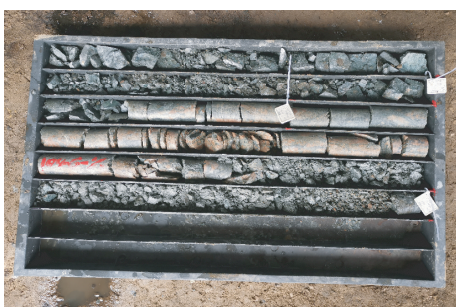
图6 2299.50~2300.72 m孔段岩心

2299.50~2300.72 m孔段,出现蚀变带,岩石软、碎(见图6),由于不清楚蚀变带长度,采取提高冲洗液粘度和密度,至钻孔终孔,这一孔段未出现垮塌情况。