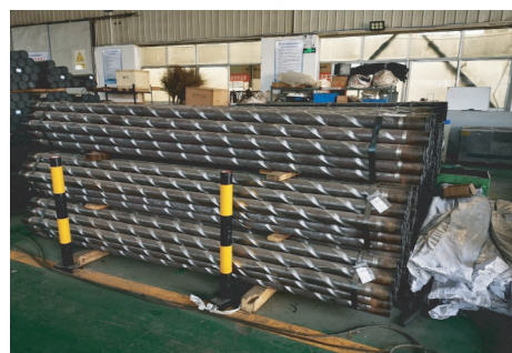
图1 螺旋刻槽通缆钻杆