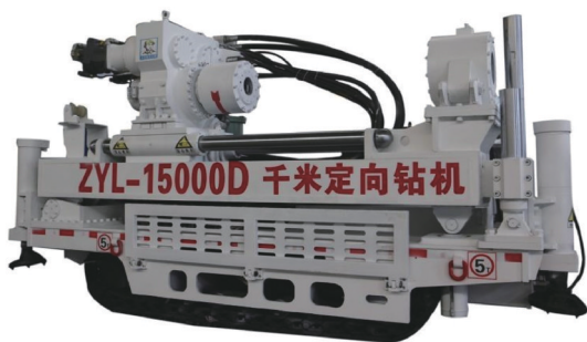
图2 煤矿坑道定向钻机

如ZDY4000LD(C)型钻机,其扭矩为4000 N·m,因为水平定向钻探回阻阻力大,以其扭矩作为衡量标准是合理且符合实际的。根据钻孔直径和深度需要,目前我国的坑道钻机已经相继开发了17000 N·m和25000 N·m大扭矩钻机产品(见图2)。