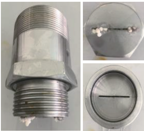
图3 热塑性复合堵漏材料堵漏效果